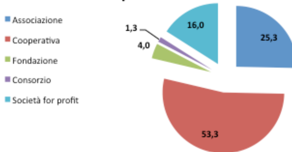
Progetti a Catalogo per natura giuridica dei privati