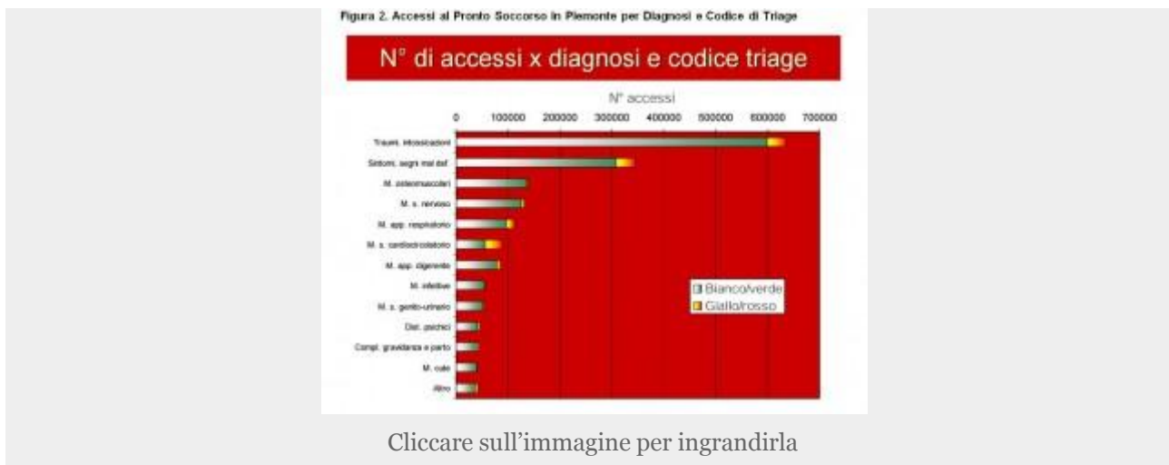
Figura 2. Accessi al Pronto Soccorso in Piemonte per Diagnosi e Codice di Triage

Se a quanto scritto uniamo il fatto che l'unica rete cardiologica esplicitata nel Regolamento è quella relativa all'infarto miocardico acuto, appare sensato un certo grado di preoccupazione da parte dell'ANMCO e non troppo peregrina la loro proposta di inserire uno specialista cardiologo negli ospedali di base.