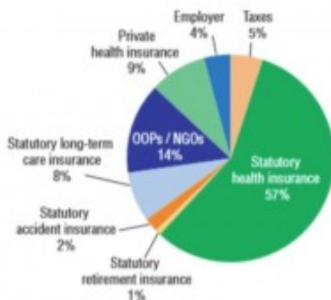
Figura 3. Finanziamento del sistema sanitario tedesco. 2014.