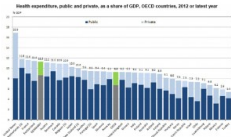
Figura 1. Spesa sanitaria, pubblica e privata, come % del PIL. Paesi OCSE, 2012.