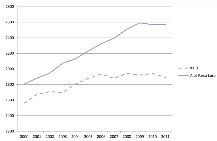
FIGURA 1. SPESA SANITARIA PUBBLICA PRO CAPITE, 2000-11, ITALIA E ALTRI PAESI AREA EURO