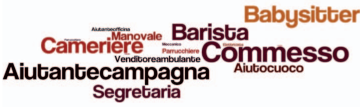
Figura 3 - Le attività principali al di fuori della famiglia

Considerando una batteria di informazioni sui tempi di lavoro (tab. 3), emergono le seguenti tendenze principali: